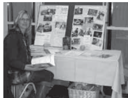
Einer der Stände, an denen die 37 Selbsthilfegruppen die interessierten Besucher informierten.

Bemerkenswert auch die Ausstellung „Aphasie verstehen“ des Aphasikerzentrums mit Fotos und zugehörigen persönlichen Daten von Betroffenen. Besucher zeigten sich beeindruckt von dem Mut der Menschen, die trotz ihrer Sprachstörung den Weg in die Öffentlichkeit wagten und den Menschen anhand „ihrer Bilder“ auf sehr persönliche Art und Weise die Erkran-