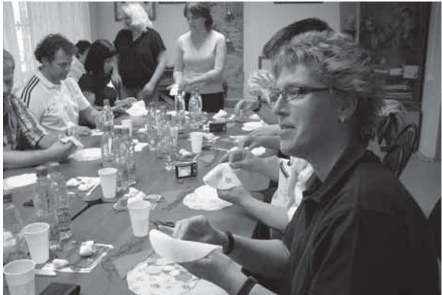
Abwechslungsreicher Unterricht: Auch Basteln im Kreativzentrum gehörte zum Angebot des Sprachkurses.

Trotz imponierender Wachstumsstatistiken steht Russland vor existenziellen Problemen: die endemische Korruption, eine besorgniserregende Ausbreitung von Drogen implizit Alkohol und eine demografische Krise. Für die Mo-