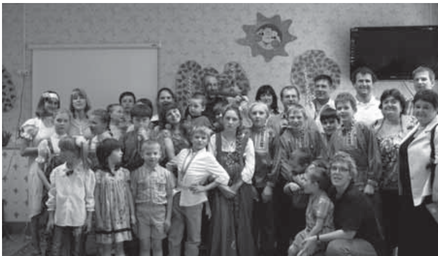
Die SprachschülerInnen zu Besuch im Waisenhaus in Nishny.

ble Erholungsanlage, die umgeben von Wald und Wiesen direkt am Ufer der Oka liegt. Die Anlage ist am ehesten mit einem deutschen Kinder- und Jugendferienheim zu vergleichen. Es gibt pädagogische, medizinische und sportliche Angebote. Das pädagogische Konzept ist auf die Herausbildung einer umfassenden Persönlichkeit angelegt. Diese Einrichtung, in der wir in sehr gut eingerichteten Einzel- und Doppelzimmern untergebracht waren, liegt m.E. deutlich über dem russischen Standard hinsichtlich des baulichen Zustandes und der Ausstattung. Die zweite und dritte Woche des Sprachkurses verbrachten wir in Nishnij Nowgorod. Nishnij liegt ca. 350 km östlich von Moskau und ist die fünftgrößte Stadt Russlands, hat ca. 1,5 Mill. Einwohner und ist eine geschäftige Industriestadt. Vieles in Nishnij weckt Assoziationen mit westeuropäischen Großstädten: die Kleidung der Menschen, Fußgängerzonen mit exklusiven Läden und große Einkaufszentren. Wie in allen russischen Großstädten liegen aber auch hier die Extreme nah beieinander: die Exzesse der „goldenen Milliarde“, von der der Schriftsteller Alexander Solschenizyn spricht, und direkt daneben tiefes Elend und bittere Armut.