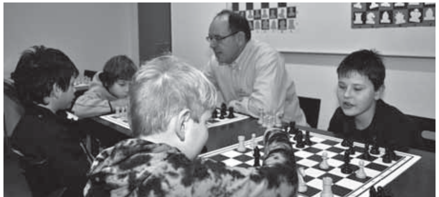
Besonders beliebt am Eröffnungstag: Das neu eingerichtete und von Experten begleitete Schachzimmer.