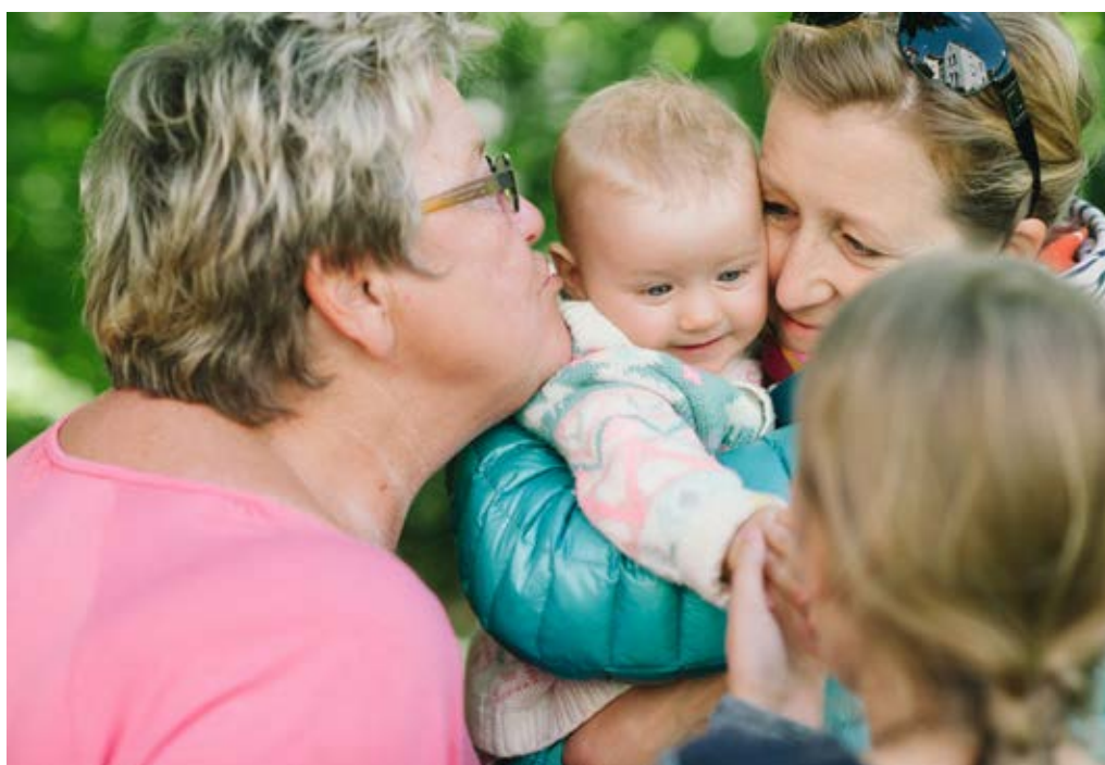
Familienglück: Manchmal, wenn es nicht so gut läuft wie hier, brauchen Menschen Hilfe. Ob es die gibt, darf dann nicht vom Geldbeutel des Wohnorts abhängen.

Allerdings besteht der Unterschied nicht nur darin, bestimmte Angebote machen zu müssen . Sondern auch darin, sie machen zu können . Dem Länderfinanzausgleich und ähnlichen Instrumenten auf Länderebene zum Trotz: Die wirtschaftliche Situation der Gemeinden im Land ist höchst verschieden. Das lässt sich dann unter anderem daran ablesen, wie viel Geld