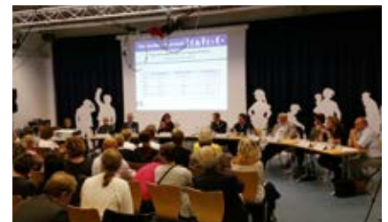
Die Podiumsdiskussion zu den Kürzungen beim Jobcenter Region Hannover.

Die Folge: Die neue Richtlinie für Arbeitsgelegenheiten (AGH), in denen Langzeitarbeitslose wieder an den Ersten Arbeitsmarkt heranrücken sollen, sieht deutlich verschlechterte Betreuungsschlüssel vor. Erst im vergangenen Jahr war der Personalschlüssel verbessert worden, Sozialpädagogen betreuten nur noch zwölf statt zuvor 18 Personen. Begründung: Die intensive Betreuung sei für Personen mit sogenannten „multiplen Vermittlungshemmnissen“ wie Menschen mit schweren Behinderungen, Menschen mit psychischen Erkrankungen oder Haftentlassene wichtig. Jetzt steigt die Relation auf 1:20. Es gibt auch weniger Plätze in Arbeitsgelegenheiten (16.600 statt 22.000), und Arbeitnehmer, die über die „Förderung von Arbeitsverhältnissen“ unterstützt werden, bekommen keine sozialpädagogische Betreuung mehr.