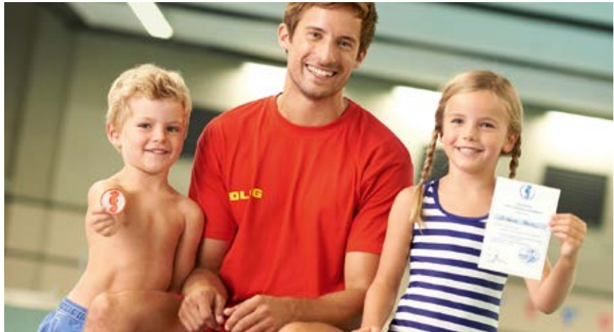
Da ist die Freude groß: Der Erwerb eines Schwimmabzeichens markiert für Kinder einen bedeutenden Entwicklungsschritt. Und schwimmen zu können, rettet im Ernstfall Leben.

In den Rahmenlehrplänen ist der Schwimmunterricht in der Schule verankert. Aber viele Schulen, vor allem im ländlichen Raum, haben gar nicht die Möglichkeit, in einer adäquaten Zeit ein Bad zu erreichen. Demnach