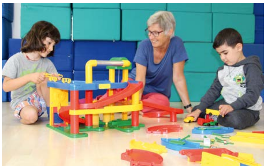
Freude am gemeinsamen Spiel, von links:

Paritätische Lebenshilfe Schaumburg-Weserbergland GmbH