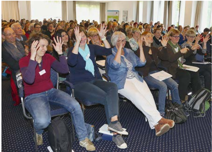
Die Kongressteilnehmenden applaudieren in Gebärdensprache.