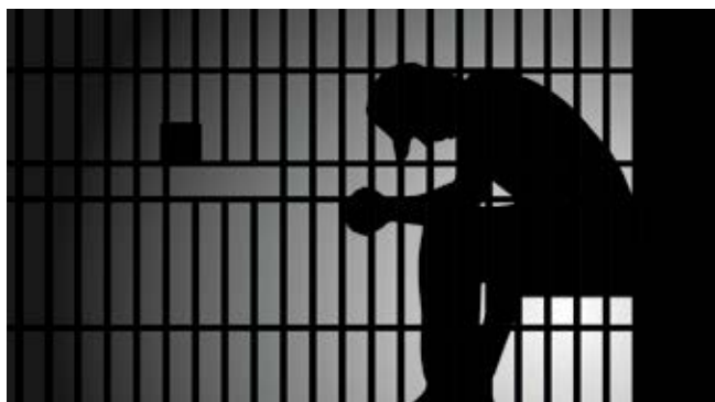
Viele Straftäter benötigen Hilfe, um nach der Entlassung ihren Platz in der Gesellschaft zu finden. Das Land muss diese wichtige Arbeit sicherstellen.

die Höhe der jeweiligen Zuwendung seit Jahren nahezu konstant. Steigende Personal- und Sachkosten werden kaum berücksichtigt und haben mittlerweile zu einer existenzgefährdenden Finanzierungslücke geführt. Eine rechtsverbindliche Richtlinie zur Förderung der Einrichtungen existiert bis heute nicht. Der erste Entwurf einer Richtlinie aus dem Jahr 2015 hätte, wäre er in Kraft getreten, das Aus für einige Einrichtungen bedeutet – die avisierten Zuwendungen wären einfach zu gering gewesen. Neben den jährlich unsicheren Zahlungen müssen die Einrichtungen um Zuwendungen aus Bußgeldern werben. Diese stellen naturgemäß ebenfalls keine verlässliche Finanzgrundlage dar und sind bei vielen Einrichtungen zudem rückläufig.