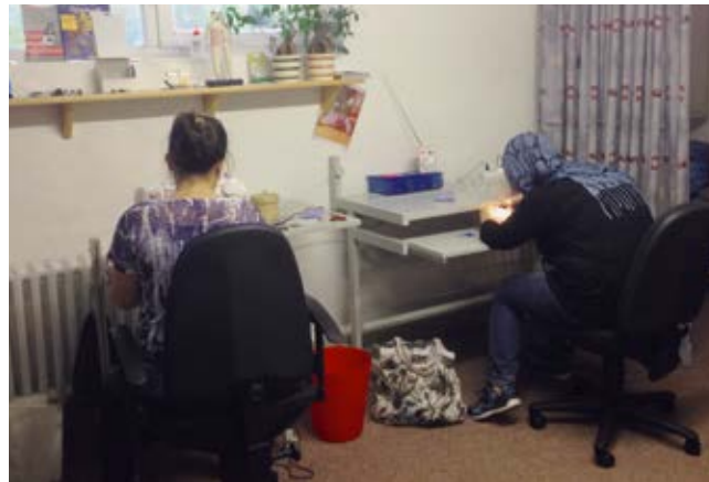
Bei der Arbeit: Aus ausrangierten Stoffen und Kleidungs- stücken nähen die Teilnehmerinnen Kissen, Taschen oder auch Spielzeugtiere neu zusammen.

Von den rund 700 Flüchtlingen im Landkreis Peine (Stand Februar 2017) haben viele eine gute Bleibeperspektive. Deshalb ist es ein vorrangiges Ziel, die Integration und Bildung voranzutreiben. Trotz rückläufiger Zahlen bleibt die Integration der Flüchtlinge mit Bleibeperspektive der Hauptansatz in der Peiner Flüchtlingshilfe. So entstand die Idee, die vorhandenen Fähigkeiten und Fertigkeiten von