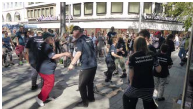
Die inklusive Tanzgruppe Weberhäuser sorgte mit ihrer Darbietung für Unterhaltung und gute Stimmung auch während der Umbaupausen.

Anika Falke Pressereferentin Paritätischer Wohlfahrtsverband Niedersachsen e.V.