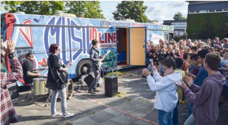
Jubel für den neuen Musikraum: Die Schülerinnen und Schüler freuen sich über den Musik-in-Liner.

Der Musik-in-Liner hat seine letzte Tour beendet: Fast zehn Jahre lang ist der zum „rollenden Tonstudio“ umgebaute ehemalige Linienbus als Projekt des Paritätischen Wohlfahrtsverbands Niedersachsen e.V. mit seiner Mitgliedsorganisation MusikZentrum Hannover gemeinnützige GmbH kreuz und quer durch Niedersachsen gefahren. Hunderte vorrangig benachteiligte Kinder und Jugendliche konnten in dieser Zeit in Workshops, Unterrichtsstunden und ähnlichen Angeboten Musik machen – dank des mit Instrumenten und Geräten zur Aufnahme und zum Abmischen ausgestatteten Busses.