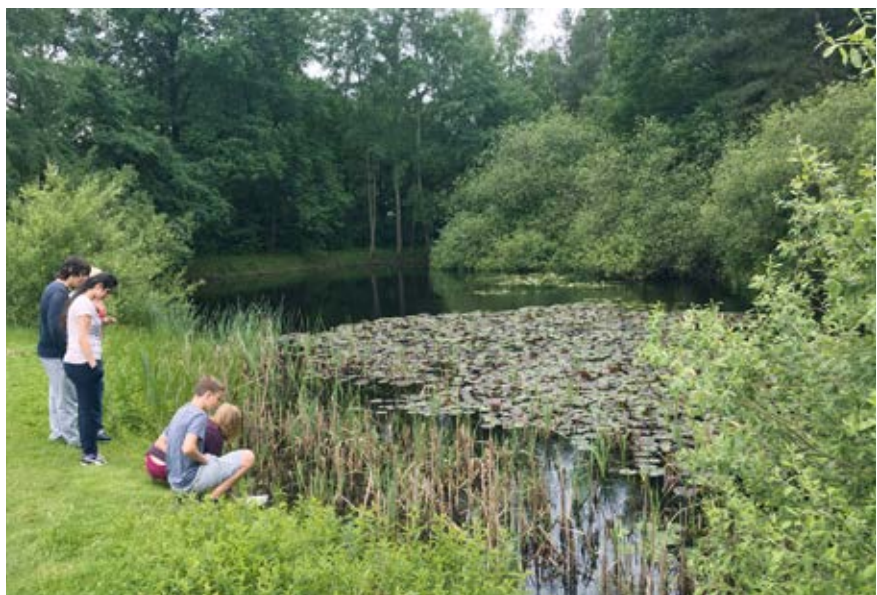
Im Einklang mit der Natur: Schülerinnen und Schüler erkunden das Außengelände des Schullandheims der Sophienschule.

In einer Zeit, in der Mobbing in den sozialen Netzwerken und Hass gegenüber anderen immer mehr um sich greifen, ist es umso bedeutender, dass die Schullandheime Zeit und Raum bieten, um sich in der Gruppe näher zu kommen, so dass aus einer Lerngemeinschaft eine Lebensgemeinschaft wird. Hier wird ein echtes Miteinander praktiziert und es werden neue Erfahrungen gesammelt bei der Anwendung von sozialen Regeln sowie im Umgang mit Verschiedenheiten. Das ist von besonderer Bedeutung vor dem Hintergrund wachsender Flüchtlingszahlen in den Gruppen und praktizierter Inklusion an den Schulen. Es werden Konflikte gelöst, neue Freundschaften gebildet, neue Stärken an sich selbst und anderen entdeckt. Da die Gruppen ihren Aufenthalt selbstbestimmt frei gestalten, wird das Erlernen verantwortungsvollen Handelns innerhalb der Gruppe gefördert.