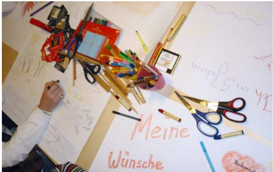
In der Selbsthilfegruppe für vergewaltigte Frauen, ein Angebot des Frauennotrufs Göttingen, verarbeiten die Betroffenen ihre Erlebnisse und Hoffnungen unter anderem auf kreativem Weg.