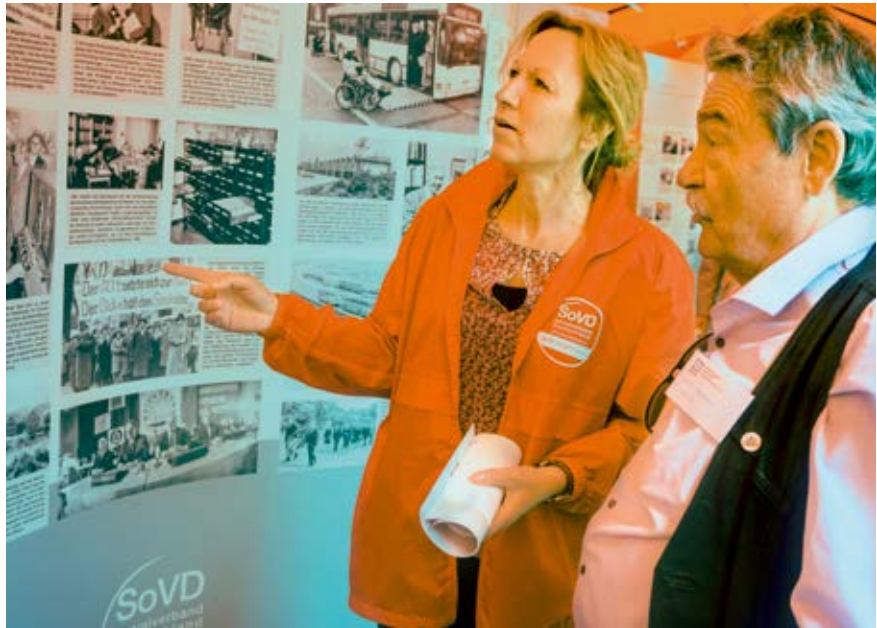
Besucher konnten sich auch die multimediale Wanderausstellung des SoVD angucken. Derzeit ist sie in ganz Niedersachsen unterwegs.

„Wenn es den SoVD nicht gäbe, müsste man ihn erfinden.“ Mit diesen Worten hat Bernd Busemann, Präsident des niedersächsischen Landtags, die Bedeutung des Sozialverbands anlässlich dessen 100. Geburtstags deutlich gemacht. Neben Bernd Busemann und dem Vorsitzenden der paritätischen Mitgliedsorganisation SoVD-Landesverband Niedersachsen e.V., Adolf Bauer, bedankte sich bei dem offiziellen Festakt zum 100-jährigen Jubiläum, der am 07.06.2017 im niedersächsischen Landtag gefeiert wurde, auch Kultusministerin Frauke Heiligenstadt für den unermüdlichen Einsatz des Verbands gerade im Hinblick auf die Inklusion.