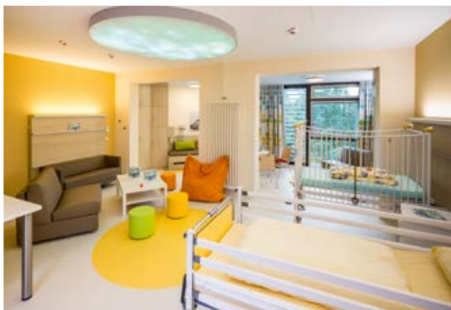
Neues Patientenzimmer im Kinder- und Jugendkrankenhaus Auf der Bult.

Ab Mitte September werden die Bereiche der Kinderchirurgie/Kinderurologie, HNO, Kinder- und Jugendmedizin III (mit Diabetologie, Endokrinologie, Gastroenterologie sowie Dermatologie und Allergologie) und Kinderneurologie auf die drei Etagen im Bettenhaus zurückkehren. Hier stehen dann 114 Krankbetten zur Verfügung, weitere 37 können bei