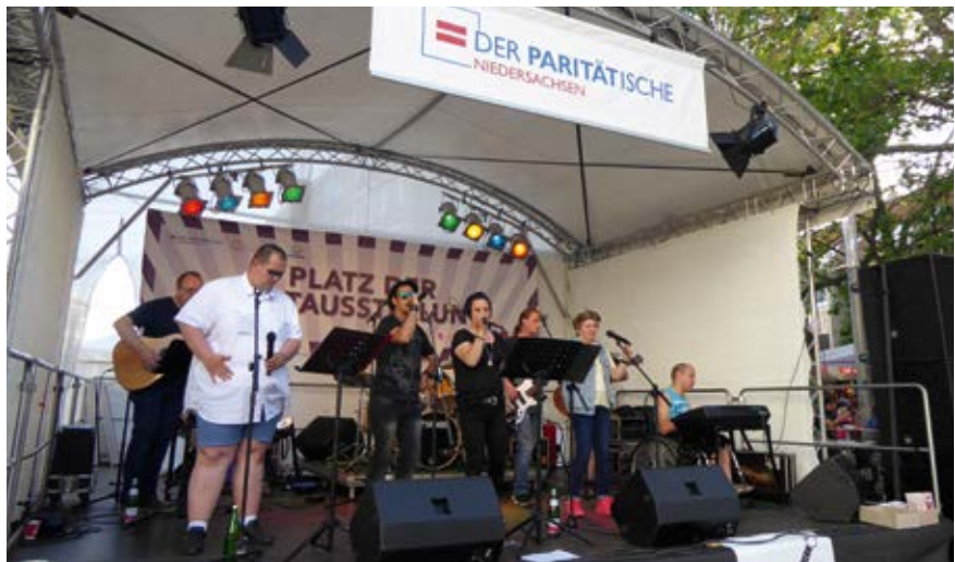
Sie brachten das Publikum zum Mitrocken: Die LeWis auf der „paritätischen Bühne“.

Menschen mit und ohne Beeinträchtigung, mit und ohne Migrationshintergrund, Kinder, Jugendliche und Ältere präsentierten unterschiedlichste Musikrichtungen mit einer Leidenschaft, die sich auch auf das Publikum übertrug. Das Programm bot für jeden Geschmack etwas: Nach dem traditionellen Auftakt des generationsübergreifenden „Großen Trommelwirbel“ folgten Auftritte sowohl junger Bands als auch gestandener Künstler. Mit dabei waren unter anderem 8 Seasons, ein Bandprojekt des Jugendzentrums Leer, deren Mitglieder neben der „gewohnten“ Bandbesetzung auch klassische Instrumente wie Harfe und Geige spielen. The Mix, eine integrative Band