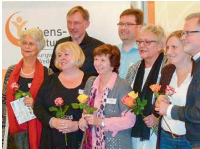
Engagiertes Team: Acht Mitarbeiterinnen und Mitarbeiter sind für die Lebensberatungsstelle für Burgwedel, Isernhagen und Wedemark tätig.

schäftsführer, und wiederum die Hälfte dieser Arbeitszeit beschäftige ich mich ausschließlich mit Anträgen, Abrechnungen, Gremienarbeit und so weiter. Die Arbeitszeit der Sekretärin kommt da noch drauf.