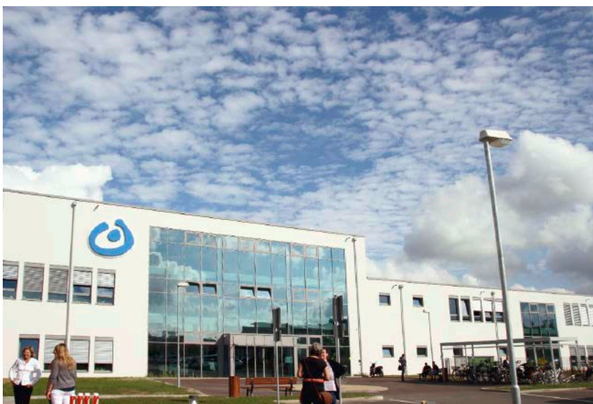
Eindrucksvoll: Das neue Berufsbildungszentrum der Lebenshilfe Braunschweig.

Elke Franzen Leitung Öffentlichkeitsarbeit Lebenshilfe Braunschweig gemeinnützige GmbH