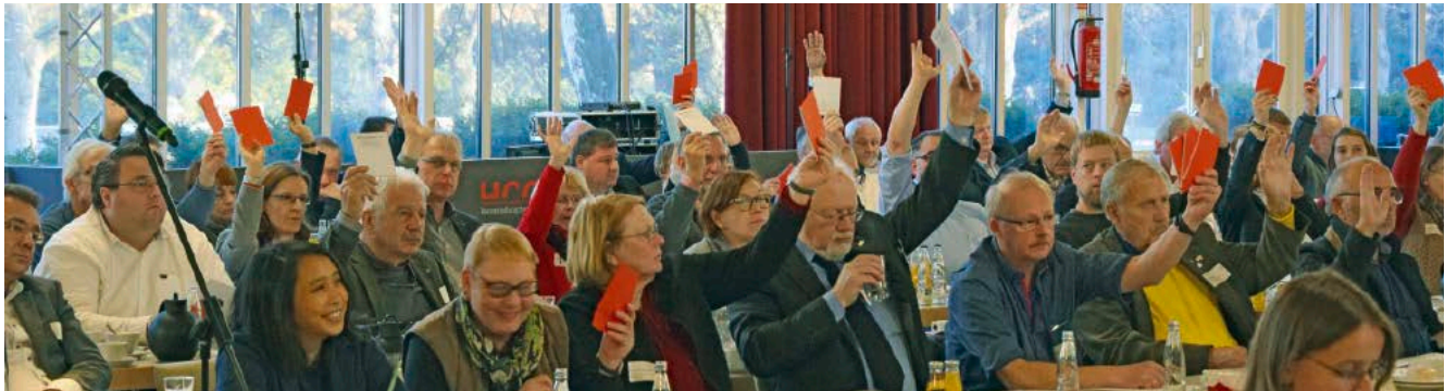
Breite Zustimmung: Die Mitgliederversammlung verabschiedet das Positionspapier „Inklusion – für alle Menschen“.

Wesentlich für unser Verständnis von Inklusion sind neben der UN-Behindertenrechtskonvention auch das Allgemeine Gleichbehandlungsgesetz (AGG) sowie die Europäische Menschenrechtskonvention (EMRK). Folgender Gedanke ist für uns der zentrale Anknüpfungspunkt: Hemmnisse und Behinderungen manifestieren sich nicht allein in der jeweiligen Person. Sie ergeben sich erst im Zusammenspiel mit behindernden Rahmenbedingungen und Strukturen.