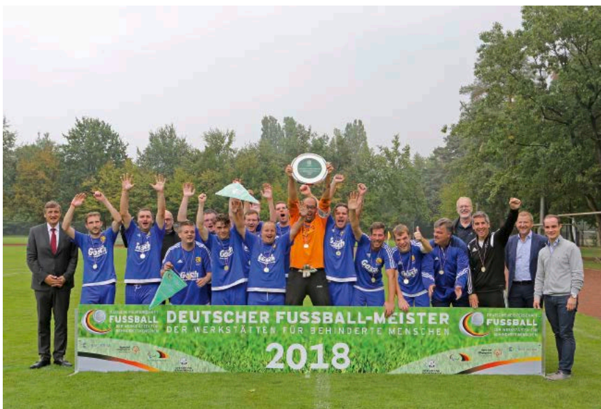
Die Fußballer der Hannoverschen Werkstätten haben sich diesen Titel hart erkämpft und wurden von Vertretern der BAG WfbM und der Sepp Herberger Stiftung geehrt.

Jedes Jahr findet in Duisburg die Deutsche Fußballmeisterschaft der Werkstätten für behinderte Menschen statt. Am 06.09.18 schossen sich die Mannschaft der paritätischen Mitgliedsorganisation Hannoversche Werkstätten gem. GmbH zum Gewinn der Meisterschaft. Ausgerichtet wird die Deutsche Meisterschaft von der DFB-Stiftung Sepp Herberger, der Bundesarbeitsgemeinschaft der Werkstätten für behinderte Menschen (BAG WfbM), Special Olympics Deutschland und dem deutschen Behindertensportverband. In diesem Jahr fand der Wettbewerb vom 03.09. bis zum 06.09.18 statt. Die Hannoverschen Werkstätten nahmen zum fünften Mal am bundesweiten Entscheid teil. Nachdem sie dreimal den vierten und einmal den dritten Platz belegten, konnten sie jetzt die Trophäe mit nach Hause nehmen.