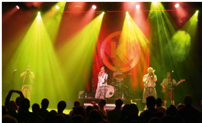
Sorgte für tanzende Massen: Kellerkommando.

Rund 500 Fans waren an dem Abend mit dabei. Alles in allem: ein gelungener Abend. Auch im Zeichen der