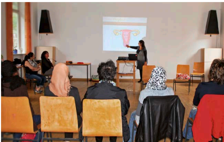
Gesprächsrunde für Frauen im geschützten Raum: In spielerisch-unterhaltsamer Atmosphäre können selbst heikle Themen angesprochen werden.

Migrierten und geflüchteten Menschen fällt es nicht leicht, sich in unserem Gesundheits- und Hilfesystem zurechtzufinden. Einen Flyer lesen, eine Beratungsstelle aufsuchen, zu einem öffentlichen Vortrag gehen? Sprachbarrieren und kulturelle Prägungen verhindern das häufig. Insbesondere Frauen werden mit der herkömmlichen Informationsvermittlung schlecht erreicht – obwohl sie eine zentrale Rolle für die Gesundheit der gesamten Familie, aber auch in der Community spielen.