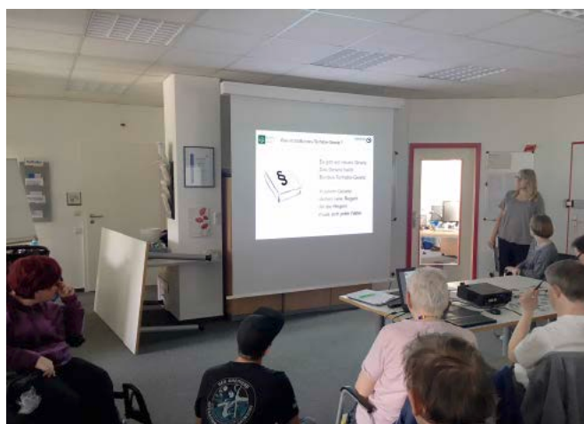
Peer-Informationsveranstaltung zum Bundesteilhabegesetz in Leichter Sprache in der Lebenshilfe Hannover.

Im Fokus steht dabei für die Lebenshilfe Hannover besonders der Personenkreis der Menschen, die behinderungsbedingt nicht oder nur eingeschränkt in der Lage sind, sich selbst zu vertreten. Menschen mit sogenannter „geistiger Behinderung“