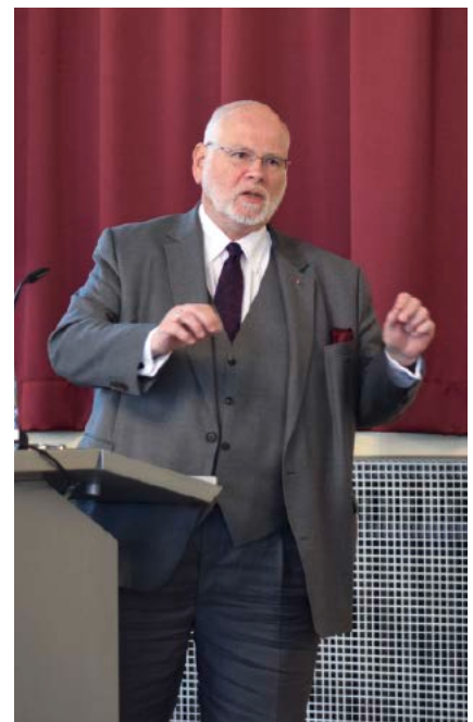
Überbrachte die Grüße der Landesregierung und positionierte sich bei der Diskussionsrunde: Heiger Scholz, Staatssekretär im niedersächsischen Sozialministerium.

An der 37. Mitgliederversammlung des Paritätischen Wohlfahrtsverbands Niedersachsen e.V. im Hannover Congress Centrum haben Vertreterinnen und Vertreter der mehr