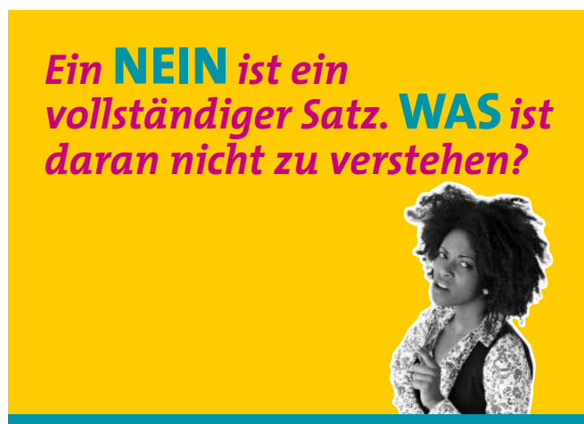
Aktionspostkarte der Kampagne „Für ein selbstbestimmtes Leben – frei von (sexualisierter) Gewalt!“ des Frauennotrufs Hannover.

Gleichberechtigung, Teilhabe für alle, Gewalt an Frauen und Mädchen (und Männern und Jungen) – das sind keine