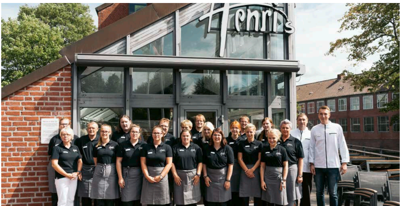
Freuen sich über die Auszeichnung: Die Mitarbeiterinnen und Mitarbeiter des Henri’s.