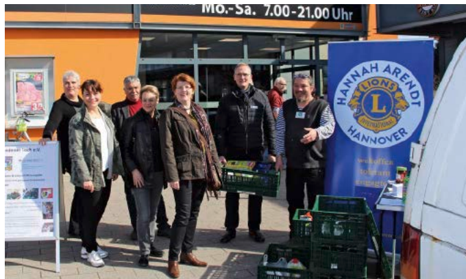
Erfolgreiche Aktion: Das Team vom Lindener Tisch sammelt gemeinsam mit dem Lions-Club Hannover Lebensmittelspenden vor einem Supermarkt.