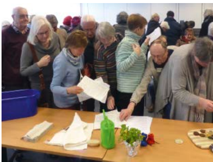
Gut besucht: Das Interesse am Fachvortrag in Hannover war groß.

Kneipp-Vereine, Kneipp-Kindertageseinrichtungen, Seniorinnen und Senioren in Niedersachsen und Bremen – sie alle sollen, gut gerüstet und mit großer Überzeugungskraft, Menschen in Zeiten des Sozialabbaus und massiver Einsparungen im Gesundheitswesen alternative Wege aufzeigen, um eine größere Selbstverantwortung für die eigene Gesundheit zu übernehmen. Dies hat sich die paritätische Mitgliedsorganisation Kneipp-Bund Landesverband Niedersachsen-Bremen e.V. zum Ziel gesetzt. Getreu den Worten Sebastian Kneipps „Ich will, dass meine Lehre allen Menschen zuteilwerde“, gibt der Verband hierfür Hilfestellungen und Anregungen. Anhand von drei Veranstaltungen, die der Kneipp-Bund in Niedersachsen und Bremen 2018 durchführte, soll dies beispielhaft dargestellt werden.