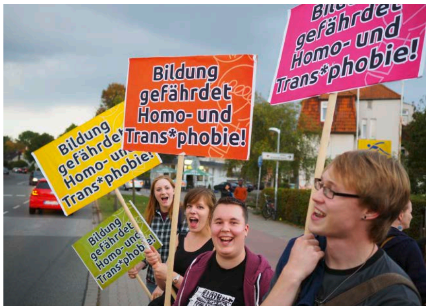
SCHLAU Teamer_innen bei einer Demo gegen eine AfD Veranstaltung zum Thema ‚Sexuelle Vielfalt in der Schule‘

Die paritätische Mitgliedsorganisation SCHLAU Niedersachsen e.V. organisiert Bildungs- und Aufklärungsveranstaltungen zu geschlechtlicher Identität und sexueller Orientierung in Schulen und anderen Einrichtungen. In Projekten mit Schulklassen werden die Grenzen der Akzeptanz gut sicht-