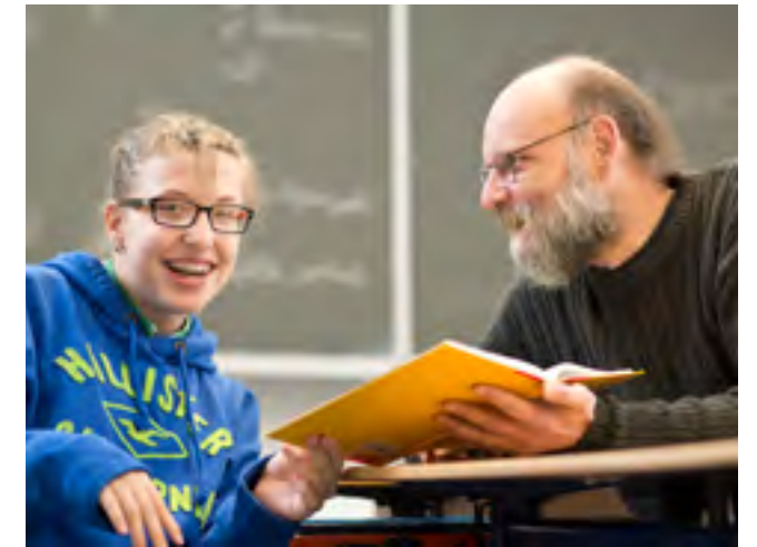
Schüler*innen mit einer körperlichen, geistigen und/oder seelischen Behinderung können Anspruch auf Schulbegleitung haben.

Viele zusätzliche Stunden hat das Team der Offenen Hilfen investiert, um die Anforderungen und Bedürfnisse aller Beteiligten – vom Kind über die Eltern und Schulen