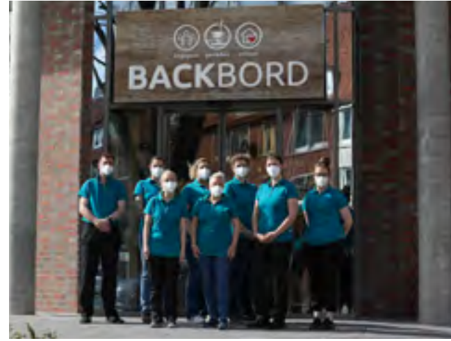
Das Team vom Backbord freut darauf, Kunden in der Ringstraße 14 in Emden zu begrüßen.

Das Ausbildungscafé Backbord der Ostfriesischen Beschäftigungs- und Wohnstätten GmbH (obw) hat im April eröffnet.