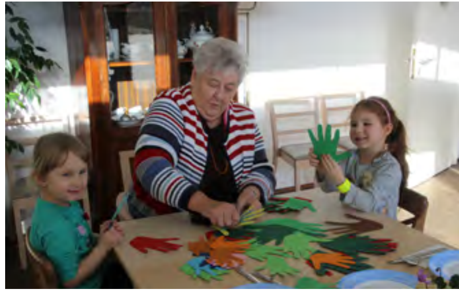
Gemeinsam kreativ sein macht Spaß: Im Projekt Altersrand basteln Alt und Jung zusammen.

Intergenerativität ist seit mehr als 40 Jahren ein Grundpfeiler des SOS-Mütterzentrums. Angesichts der abnehmenden Kontakte zwischen den Generationen wird die Notwendigkeit altersgemischter Begegnungsräume immer dringender. Vor diesem Hintergrund entstand