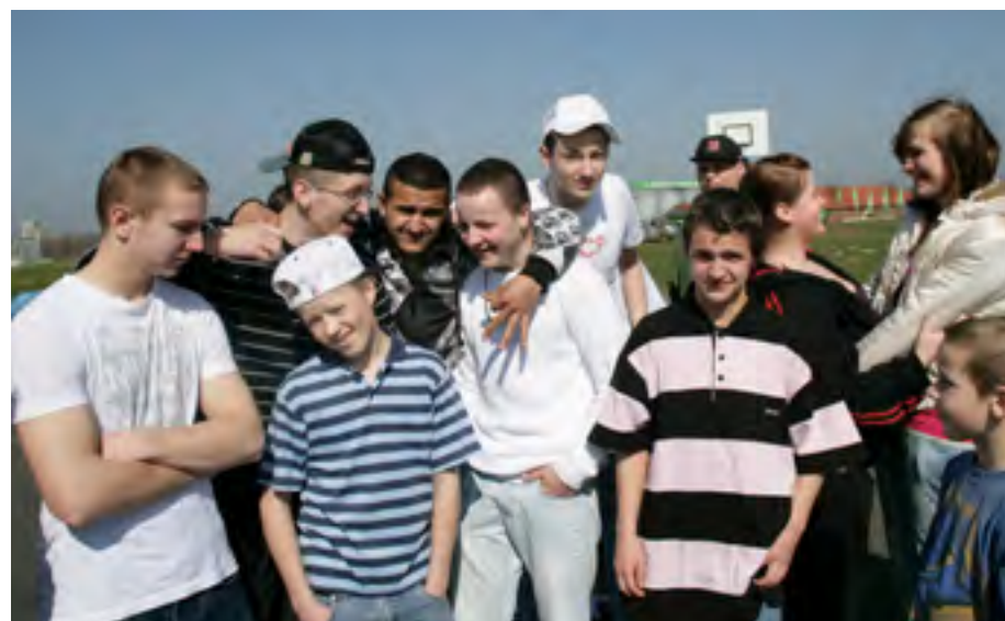
Rumalbern in der Gruppe – solche alltäglichen Erlebnisse sind wichtig für Jugendliche. In der Corona-Pandemie waren sie nicht möglich.

Das hängt stark vom Elternhaus ab. Haben die Kinder Rückzugsräume? Ist Konzentration auf die vielen Home-schooling-Aufgaben überhaupt möglich? Schaffen es die Eltern gemeinsam mit den Kindern, Struktur in den ungewohnten Alltag zu bringen? Viele Familien sind da überfordert. Wo es vorher schon Probleme gab, bricht das jetzt erst recht auf. Übergewicht, psychische Probleme, Spannungen in der Familie bis hin zu Gewalt – all das hat sich in der Pandemie verstärkt. Da fehlt auch die Beobachtung durch Lehrkräfte, Schulpsychologinnen, Sozialpädagogen. Die bekommen im normalen Alltag mit, wenn es einem Kind nicht gut geht. Kurz: Wer vor der Krise schon Probleme hatte, hat sie jetzt noch mehr. Wer