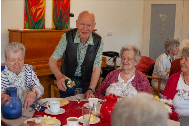
Frühstück mit Bingo

Anliegend ein exemplarischer Veranstaltungskalender.